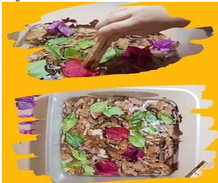
Ação 3 (proposta para 4ª feira)

Vamos assistir à videoaula: https://youtu.be/McnyVlu-VTo Depois, vamos fazer uma pescaria de flores? Colha pétalas de flores e folhas secas, separe uma vasilha com água e prendedores de roupas. Tente pegar as pétalas com o prendedor. Segue imagem ilustrativa: